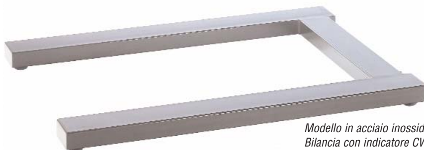
Modello in acciaio inossidabile Bilancia con indicatore CW-11