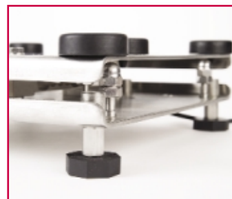
Nessuna filettatura a vista per garantire la conformità agli standards delle preparazioni alimentari e minimizzare le aree di possibile contaminazione