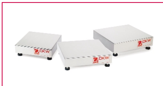
4 portate per 3 misure di piattaforme