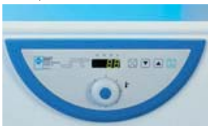
Gestione con microprocessore fuzzy logic

Per il migliore controllo della temperatura all'interno della camera, la gestione avviene con microprocessore di controllo