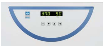
Gestione con microprocessore

Per il migliore controllo della temperatura all'interno della camera, la gestione avviene con microprocessore di controllo PID.